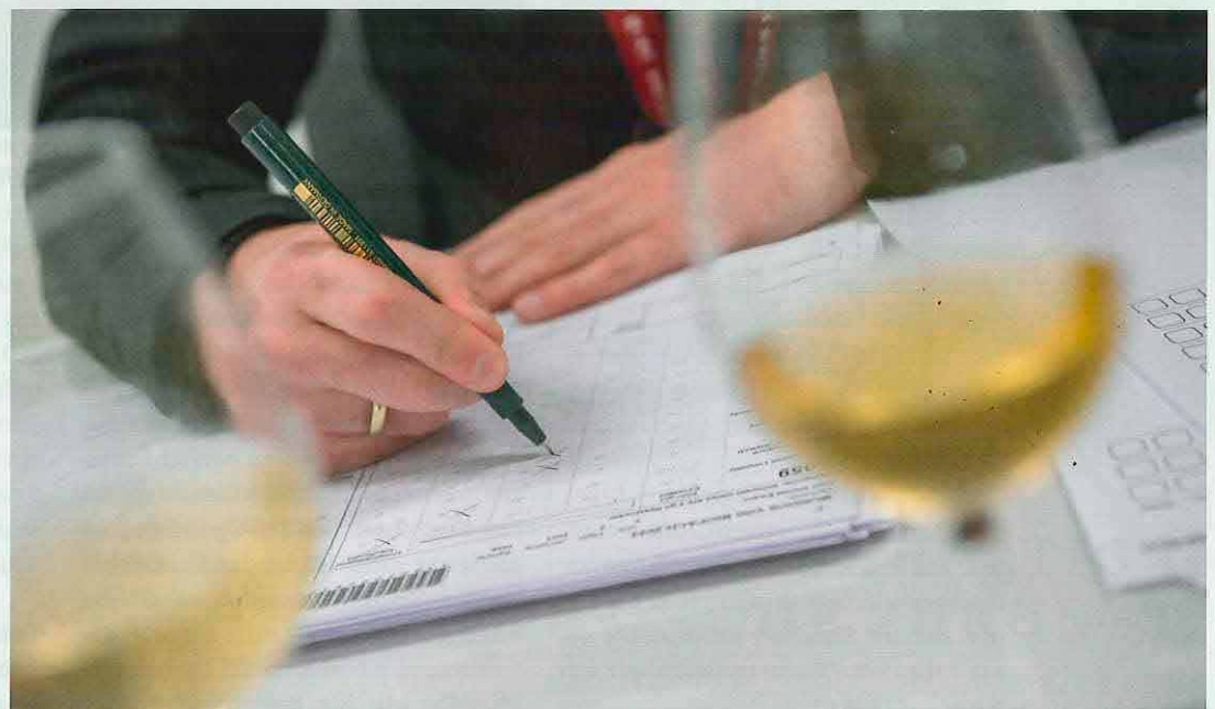
Konzentriertes Verkosten und gewissenhaftes Bewerten bei MUNDUS VINI Biofach 2023